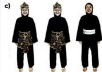
c) ATLET TGR PUTRI BERHIJAB