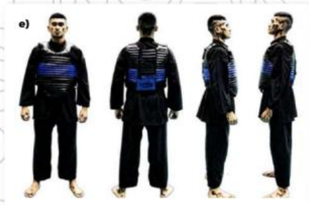
e) ATLET TANDING SUDUT BIRU