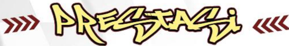
TABEL KLASIFIKASI JURUS/SENI (PRESTASI)