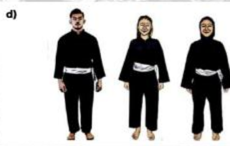
d) ATLET SENI BEREGU